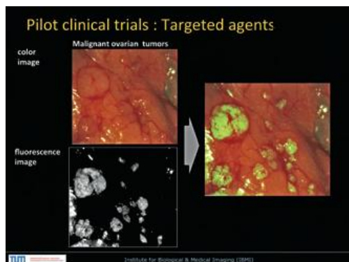
L'image montre des cellules de cancer de l'ovaire (en vert) rendues visibles lors d'une opération, à l'aide d'un système d'imagerie à fluorescence multispectrale

Pour en savoir plus : www.helmholtz-muenchen.de Contact : Vasilis Ntziachristos, Centre Helmholtz de Munich E-mail : v.ntziachristos@tum.de