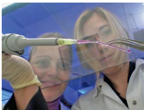
Un tube de polymère pouvant servir de vaisseau sanguin artificiel est rempli d'un liquide cellulaire.

La mise au point de vaisseaux sanguins représentait pour les chercheurs le défi d'être capables de construire des structures petites et complexes telles que des structures capillaires. Ils se sont inspirés du domaine des techniques de production, qu'ils ont appliquées aux biomatériaux élastiques. Il en a résulté l'association de différentes technologies : les techniques d'impression utilisées en prototypage rapide, permettant de concevoir des pièces à usiner d'après des modèles 3D complexes définis par l'utilisateur, ainsi que les techniques de polymérisation mises au point dans la recherche sur les polymères. Cette dernière technologie fait appel à des impulsions laser intenses pour exciter les molécules du matériau tellement fortement qu'elles interagissent entre elles pour former de longues chaînes. De cette façon, le matériau polymérise et se solidifie tout en restant aussi élastique que les matériaux naturels. Ce processus permet de construire des structures extrêmement fines sur la base de plans en trois dimensions. Il en résulte que les vaisseaux synthétiques sont bio-fonctionnalisés de sorte que les cellules vivantes du corps peuvent s'accrocher à eux et permettre le transport d'éléments nutritifs comme c'est le cas de leurs modèles biologiques naturels.