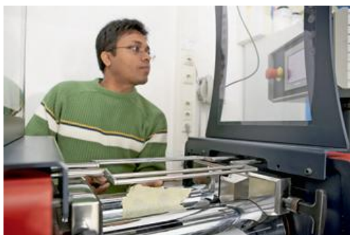
Un chercheur venant de l'Inde à l'Institut Leibniz de recherche sur les polymères de Dresde

Les instituts Leibniz prennent une première décision de manière autonome et classent la qualité des candidatures et de leur projet de recherche. Le DAAD leur apporte sa connaissance de base des universités respectives, de leurs classements, etc. Le choix final est