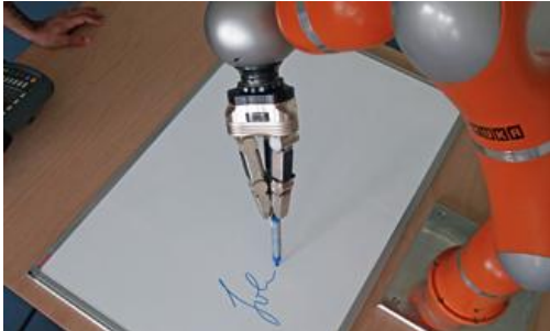
Échantillon d'écriture manuelle : des chercheurs de Göttingen ont mis au point un robot capable de maîtriser des mouvements fluides du type de ceux qu'il faut mettre en œuvre pour écrire ou pour saisir un objet.